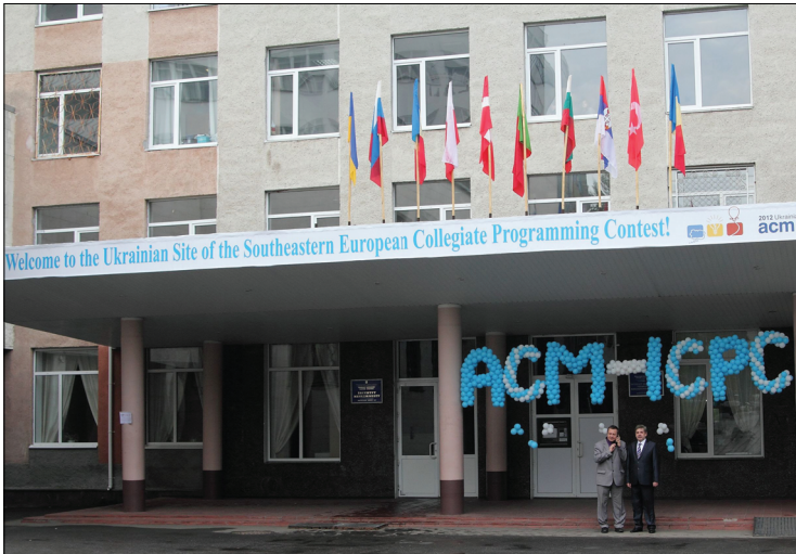
Усі прапори в гості до нас!