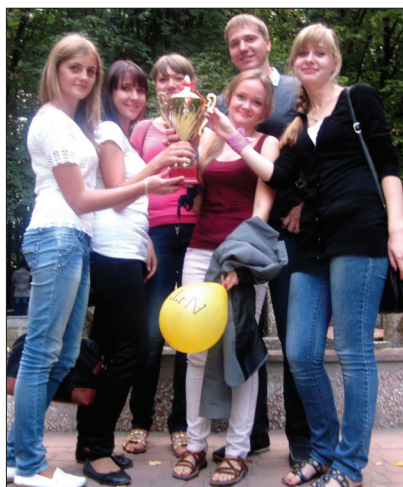
Зв'язку святкує «АнтиКіПіШ» (ІНМ)

Після двох срібних місць у попередніх іграх звиягу святкували гравці ко-