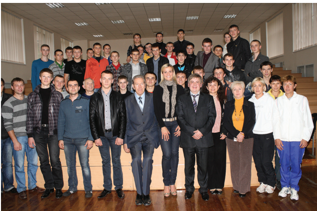
Колективне фото на задку

по-іншому. Вінницький політех взагалі єдиний виш у Вінниці, який має свій стадіон. Педагогічний університет, на жаль не має свого стадіону. Це величезна проблема для їхніх спортсменів. А за кордоном обов'язково кожна школа має свій стадіон і такий, що на ньому можна проводити змагання міжнародного рівня. Приміром, у Празі сім стадіонів найвищого рівня. Це в одному місті! Але я певна: наші спортсмени сильні і талановиті, їм це надає їм додаткових сил, цілеспрямованості, терпіння, формує характер, що при гірших умовах наші спортсмени показують кращий результат!