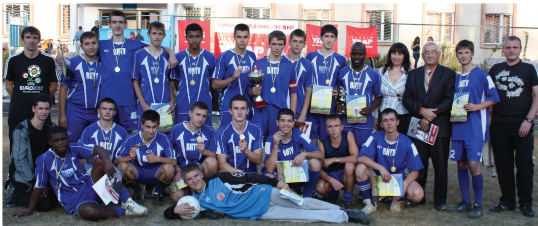
Переможна збірна першокурсників

Сподіваємось, що найкращі футболісти турніру займуть на-