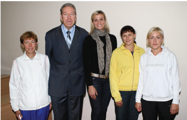
З викладачами кафедри фізичного виховання ВНТУ.

— Зараз губернатор Микола Джига підняв планку фізичної культури в нашій області. Він дуже активно популяризує спорт. Це чудово. Але змінювати треба усе кардинально. Усі знають про про-