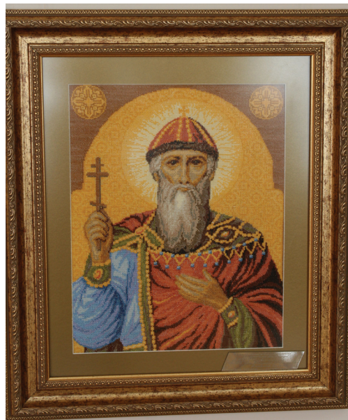
Ікона святого рівноапостольного великого князя Володимира