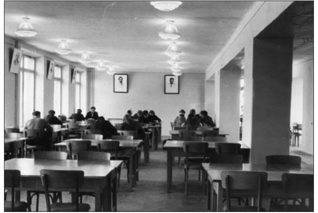
Читальний зал бібліотеки, 1976 рік

Пріоритетним напрямком роботи є популяризація української мови, народознавства, краєзнавства. Розроблено комплекс заходів «Мова моя калинова...», «Славетна плеяда Вінниччини». Щорічно НТБ бере участь в Днях Коцюбинського, Днях Стуса. Багато різноманітних заходів спрямовано на допомогу навчальному процесу. Традицією стало оформлення книжкових виставок «Внесок вчених ВНТУ в науку та виробництво», «Зверніть увагу на ці видання», «Наукові публікації працівників ВНТУ». Всього в бібліотеці щороку оформляється понад 80 виставок.