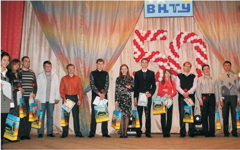
Гордість університету – магістри

та Африки, а тому має високий імідж в цих країнах, особливо після виконання нами масштабних освітніх проєктів в консорціумах з багатьма університетами Федеративної Республіки Німеччини, Франції, Італії, Данії, Швеції, Іспанії, Португалії і Великобританії, завдяки чому провідні європейські фірми з задоволенням нам поставляють безкоштовно своє сучасне обладнання для оснащення наших навчальних лабораторій, що дозволяє нашим випускникам працювати як у рідній країні, так і за кордоном на сучасному обладнанні без втрат часу на адаптацію, і, як наслідок, диплом нашого університету сьогодні визнається у більшості країн світу, у тому числі і тих, з якими в Україні ще немає договорів про взаємне визнання інженерних дипломів.