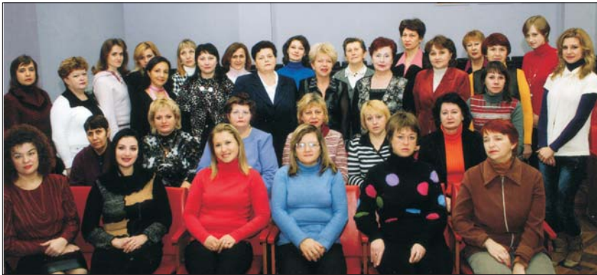
Колектив університетської бібліотеки

Бібліотека сьогодні – не тільки зібрання книг, але й мозковий осередок університету, який перебуває в центрі академічного життя.