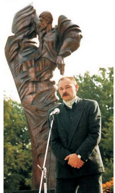
Поет і син поета