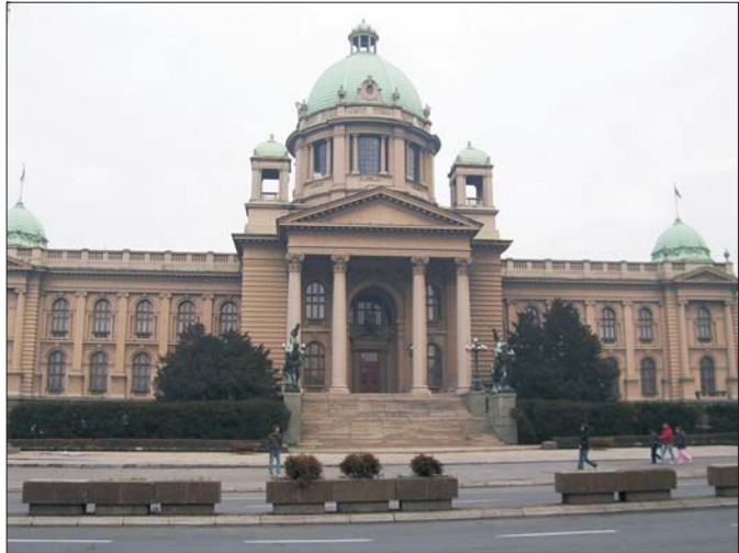
Палац Парламенту Сербії

В іншій номінації золото «Nikola Tesla» отримав «Мікроелектронний частотний пристрій для моніторингу навколишнього середовища», який захищений вісьмома патентами. Автори його — професор ОСАДЧУК-молодший і професор ОСАДЧУК-старший.