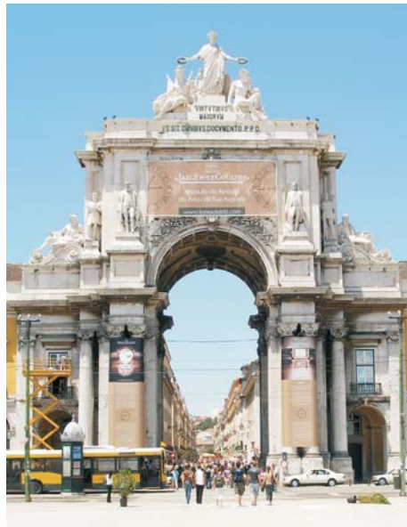
Лісабонська тріумфальна арка є зменшеною копією Паризької