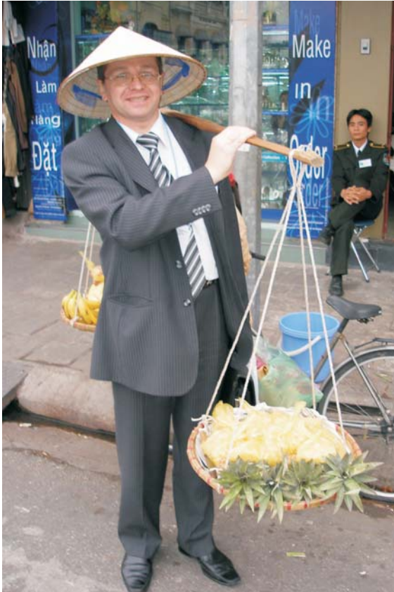
Як воно — побути в'єтнамцем?