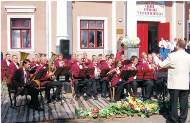
Грає оркестр для Тиманівки

В ідсвяткувало своє 400-річчя старовинне село Тиманівка Тульчинського району, яке славиться своєю історією, традиціями, талановитими людьми. Тиманівка – єдине в Україні село, де діють три народні музеї, в яких зберігаються сотні історичних експонатів. У цьому селі жив і творив завершення «Науки перемагати» видатний полководець О.В. Суворов.