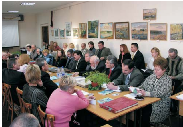
На день народження ЦКіВС прийшло чимало знаних вінницьких митців. Не тільки, аби привітати, а й за «круглим столом» підсумувати багаторічну творчу співпрацю

— Інженер, конструктор — це технічний творець. Саме тому творчість підтримується в нашому університеті і не є відволікаючою, а навпаки такою, що допомагає власне