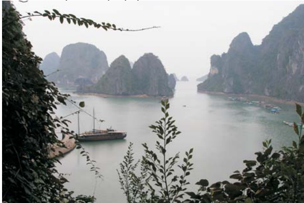
Холонг (Затока Дракона) в Південно-Китайському морі — одне з найдивніших місць світу. Архіпелаг складають понад 2000 островів. Саме тут знімали фільм «Кінг-Когн». Цікаво, що дві третини островів — приватна власність. Є навіть острів космонавта Титова, йому подарував його особисто генсек В'єтнаму Хо Ши Мін

Виставка-презентація наукових розробок і технологій України у СРВ дала новий поштовх для співробітництва між В'єтнамом і Україною у сфері високих технологій.