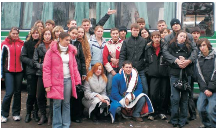
Студенти перед від'їздом у сиротинці

19 та 20 грудня студенти ВНТУ створили для дітей із сиротинців справжнісіньку казку. Нашому ректору, академіку АПНУ Борису МОКІНУ, який щороку підтримує акцію і надає університетський автобус, дітки передали рушничок, який вишили самі, і хліб-сіль як своєрідну подяку і побажання щастя і добра. А у малечі, за їх словами, з'явилася нова мрія – у майбутньому обов'язково поступити навчатися до ВНТУ і також допомагати іншим.