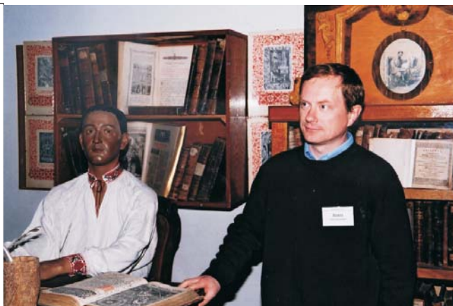
Філософи. Григорій СКОВОРОДА і Олег ХОМА

«Sententiae» видаються уже 7 рік. Нині вийшло уже 13 чисел. Виросли серйозно: у нас започаткована рубрика публікації перекладів класичних першоджерел. Статті зібрати відносно просто, а переклади — це робота, яка ніколи не буває безкоштовною. Оскільки у нас в редколегії і докола журналу згуртовані і перекладачі, то ми маємо можливість безкоштовно отримувати переклади для публікації. І ще одна ознака зростання: стабільна рубрика «Реферативні огляди» — намагаємось віднаходити сучасну зарубіжну наукову літературу і робити її огляди для наших вітчизняних гуманітаріїв. Колись за часів Союзу існували реферативні журнали. У нас, на жаль, немає можливості назбирати матеріалу на цілий реферативний журнал, але розділ є, і в кожному числі коментуємо якесь важливе джерело або щось новеньке.