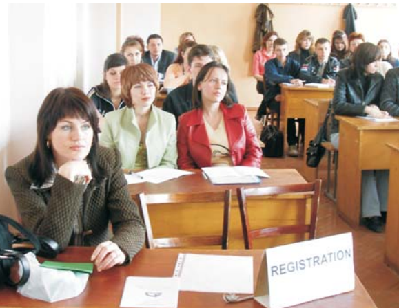
Засідання секції англійської мови

Сьогодні немає потреби когось переконувати в необхідності знання принаймні однієї іноземної мови. Спілкування людей світу на всіх рівнях у практично всіх сферах життя стає тіснішим з кожним кроком. Але попри всі технічні дива основою людського спілкування була і залишається жива природна мова, адже лише вона здатна передати всі відтінки думки, почуттів, характерів та стосунків співбесідників. Знання іноземної мови відкриває нові горизонти в освіті, кар'єрі, особистісному зростанні.