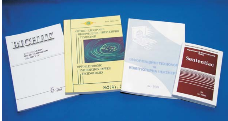
Для публікації результатів наукових досліджень університет видає чотири наукових фахових журнали

30 травня в актовій залі університету відбулося святкування Дня науки. Для святкового настрою у наших викладачів і співробітників були всі підстави, адже за підсумками діяльності вищих навчальних закладів, підпорядкованих Міністерству освіти і науки України, Вінницький національний технічний університет посів почесне друге місце у загальному рейтингу технічних і технологічних університетів. У це досягнення вагомий внесок зробили наші вчені, оскільки за всіма основними показниками наукової діяльності ВНТУ посів перше місце.