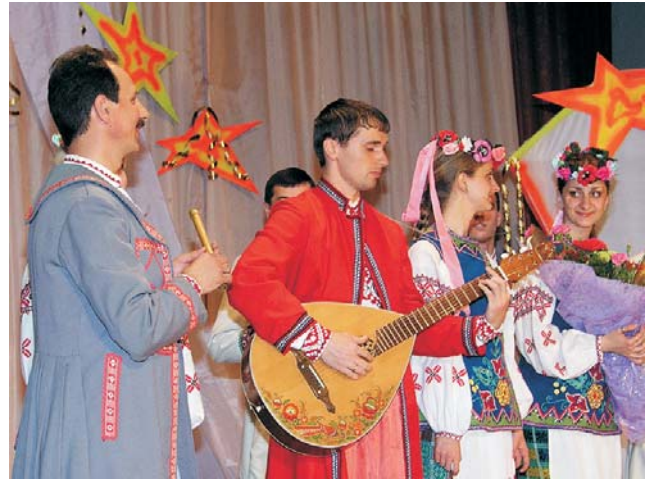
«Оберегівці» подарунок одразу випробували