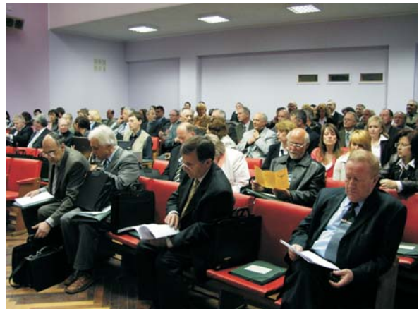
Спільне засідання Президії АПН України і Ученої ради ВНТУ веде президент АПНУ, доктор філософських наук, професор Василь КРЕМЕНЬ