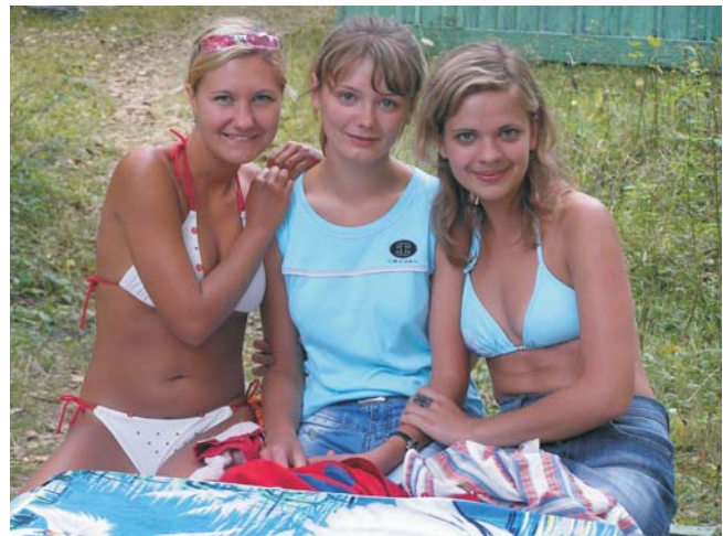
Студентки ВНТУ у Степашках