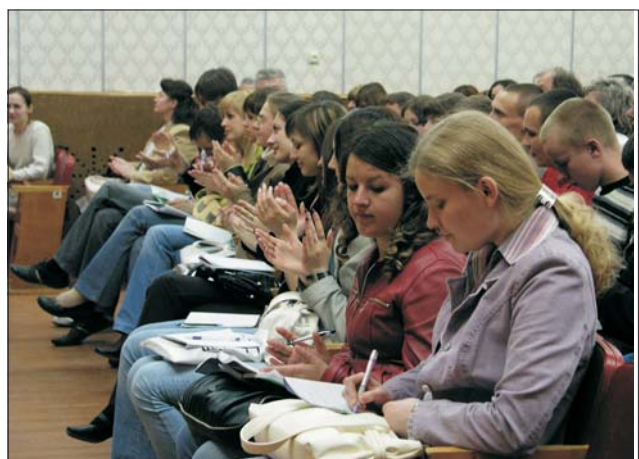
Студенти нашого технічного університету на занятті з практичної культурології. Прислухайтесь до почуттів, викликаних музикою...