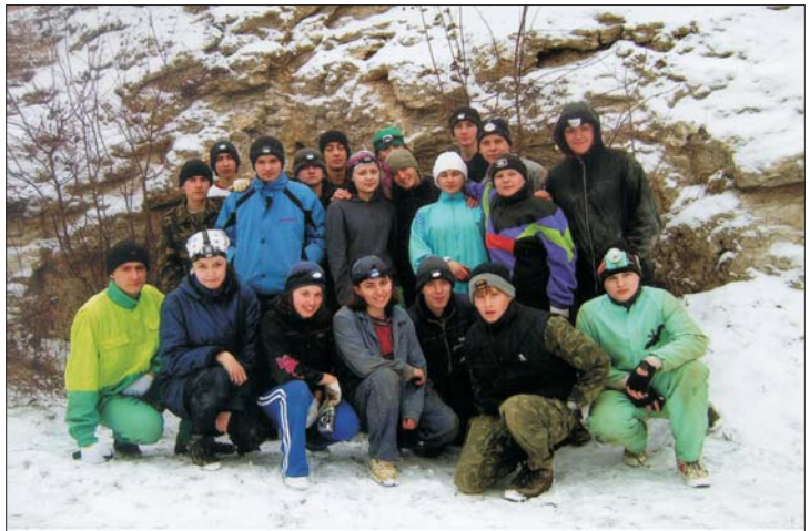
Ми — «Одіссей»

щити очі через яскраве світло нагорі, далі обливаєшся холодною водою, щоб змити із себе глину з печер, та відпочиваєш під справжню українську музику, яка постійно звучить у будинку, де ми мешкали, — розумієш, що задля відпочинку і задоволення не потрібно платити величезні кошти та їхати за кордон або на гірськолижний курорт.