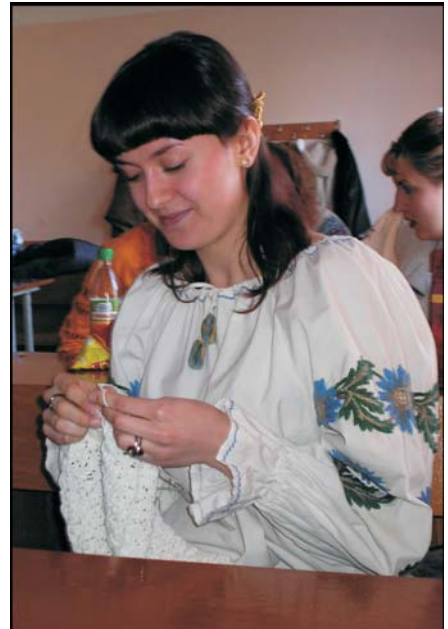
А я просто українка. Україночка

Але найнебайдужіша і національносвідома частина нашого студентства (з тих, хто читає оголошення) все ж одягнула вишиванки, не соромлячись привертати до себе увагу. Особливо активною була сама студрада, яка майже в повному складі була у вишиванках. Багато старост теж не проігнорували захід, за що їм велике спасибі. Шкода лише, що серед викладачів мало хто прийшов у вишиванках, але їм можна пробачити, адже тут, очевидно, дається взнаки те, що велику частину свого життя більшість з них прожила в умовах, коли за подібний захід можна було потрапити за ґрати, а ще русифікація... Але на мою думку, вишиванка — це не лише не соромно, а й престижно. Згадайте скільки народних депутатів носить вишиванки, згадайте літо, коли половина молоді була вбрана в сучасні вишиті сорочки.