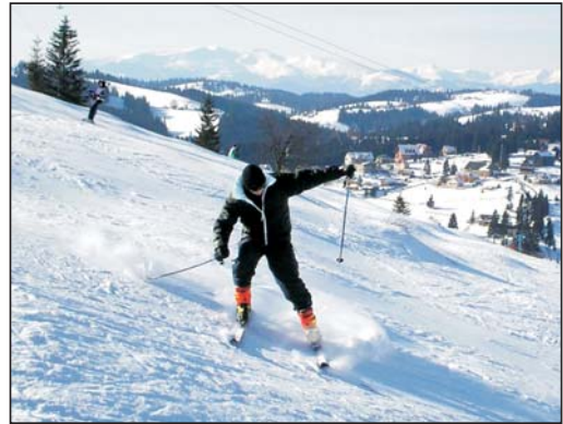
Зимова розкіш Карпат

Ми живемо в надзвичайний час. Напруженість сучасних політичних, економічних, спортивних, наукових подій, безумовно, ввійде в історію. Але в повсякденній метушні ми не звертаємо увагу на вічну, могутню, чарівну силу — природу. Вона то дарує нам сонце, тепло, свіжість, то лякає нас холодом, спекою, буревіями. Але ж все-таки це прекрасно!