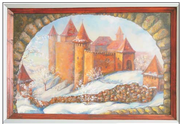
ХОТИНСЬКА ФОРТЕЦЯ (Чернівецька обл.) Фортеця є найвидатнішим пам'ятником фортифікації XII-XIV ст. Розташована вона на правому березі Дністра.