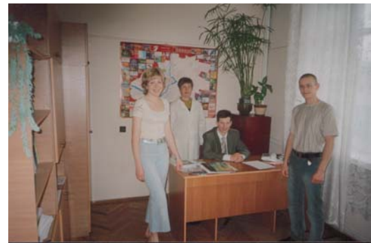
У НДЛ «ЕДЕМ»

моніторингу чому хочуть навчитись відповідно до їх функцій моніторингу та особливостей діяльності). Причому, в майбутньому планується проведення навчань не тільки з використання програмного забезпечення, розробленого в НДЛ ЕДЕМ, а й підняття рівня комп'ютерної грамотності спеціалістів суб'єктів системи моніторингу в цілому, зокрема — навчання формуванню запитів та звітів в Microsoft Access, редагування та друк карт, побудова тематичних карт та картограм в російському ГІС-пакеті «Панорама» та ін., що дозволить їм якісніше і ефективніше обробляти та представляти інформацію про стан і якість довкілля Вінницької області.