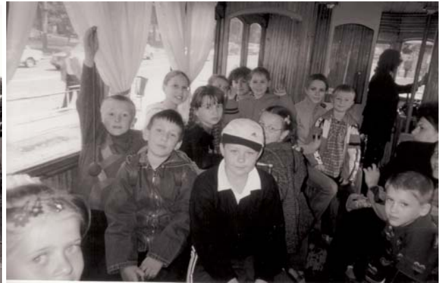
І на сторічному трамвайчику

Уже шостий рік співробітники нашого університету не переймаються тим, куди влітку, поки ще нема відпустки, відправити своїх дітлахів. У денний спортивно-оздоровчий табір «Живинка»! А бажаючих у ньому відпочивати з кожним роком усе більше. До речі, такий табір єдиний у Вінниці – жоден інший профком не бере на себе подібного клопоту. За путівку наші співробітники платять лише третину вартості. Решту – профспілковий комітет.