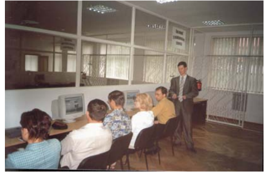
Під час роботи семінару

Тож, зацікавленість і обласних організацій є цілком логічною. Основна мета цього першого семінару — ознайомитись із загальними можливостями роботи системи, оволодіти можливостями перегляду інформації та розробити план подальших навчань (які суб'єкти