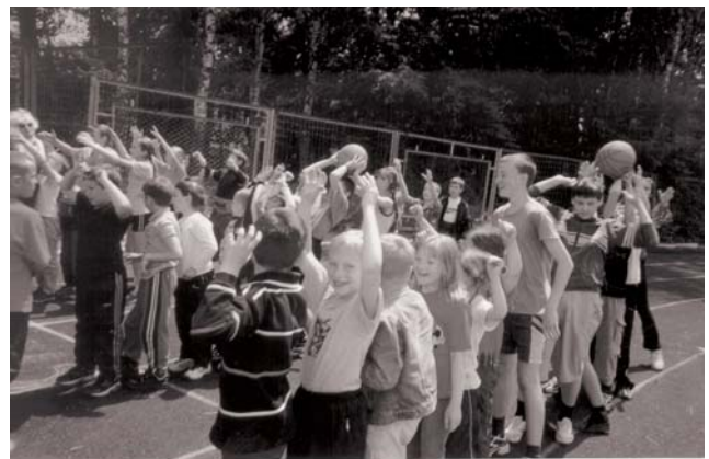
Перемагали у веселих стартах