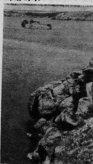
На фото: острів хохання серед Бугу.

Доросла жабка полює інакше. Сильні задні плавники рухають велике темнозеле-