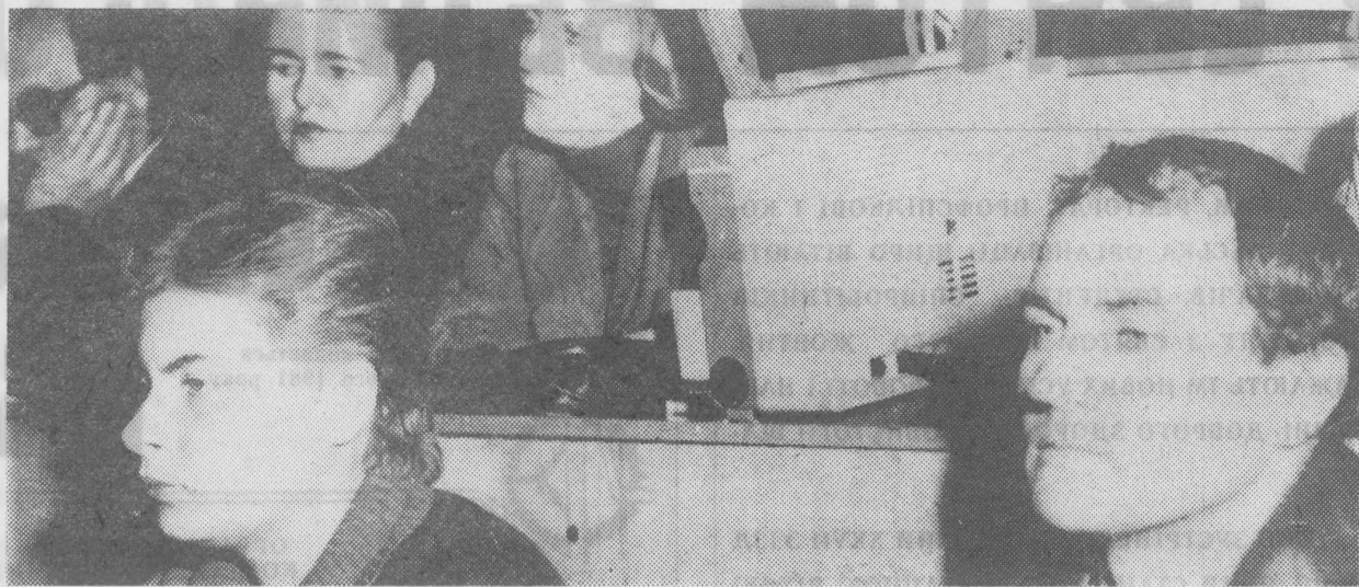
Кафедри суспільних наук інституту провели семінар з питань використання технічних засобів навчання. На зймку: під час заняття семінари.

Не забудь, комсорг, що в листопаді проводиться місячник підготовки спортивних споруд і майданчиків до зимового сезону.