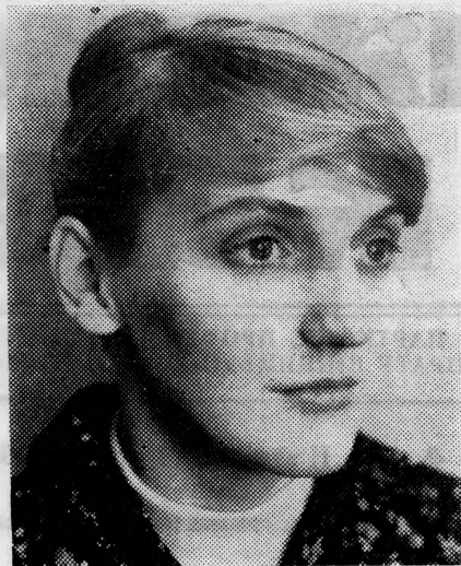
Звання комуніста, як відомо дає лише одну перевагу — бути завжди там, де важче, показувати зразки сумлінного ставлення до справи.

Думається, що було б правильно, аби комітет комсомолу інституту, факультетські комсомольські бюро, готуючись до трього, трудового семестру більше уваги приділяли не лише вивченню студентами будівельних професій, але навчали їх змістовно відпочивати, активніше включатися в громадську роботу.